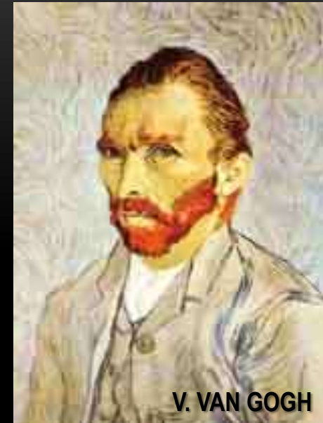
V. VAN GOGH