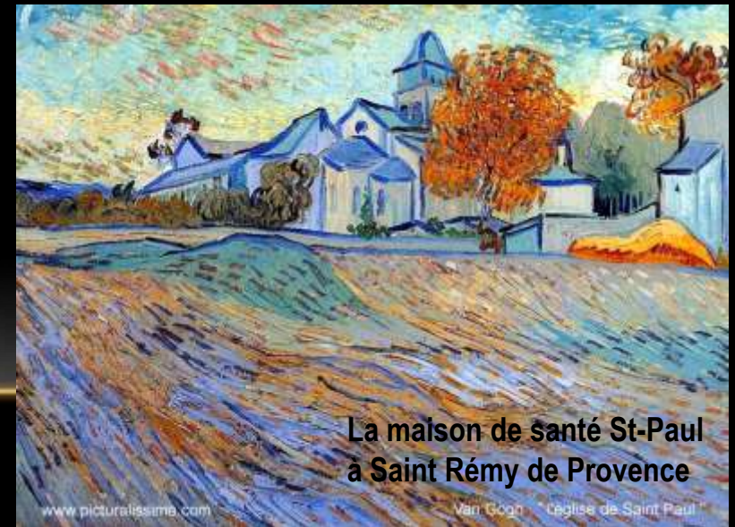
La maison de santé St-Paul à Saint Rémy de Provence